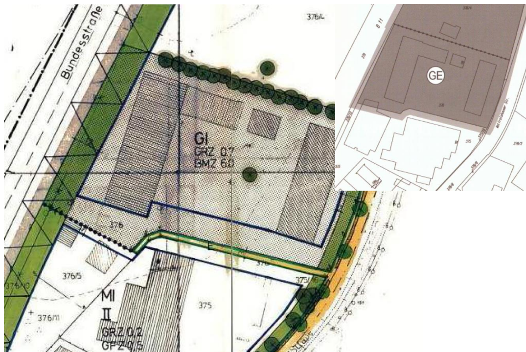
Abb. 2 Planzeichnung des Bebauungsplans Nr. 29 „Südlich der Dr.-Carl-von-Linde-Straße / Teil West“ i.d.F.v. 13.09.1983 (links) sowie der 2. Änderung i.d.F.v. 12.06.2007 (rechts oben)

Für das Plangebiet ist als Art der baulichen Nutzung ein Gewerbegebiet festgesetzt, u.a. sind Einzelhandelsbetriebe, Geschäfts- Büro- und Verwaltungsgebäude, Räume für freie Berufe sowie Vergnügungsstätten nicht zulässig. Das Maß der baulichen Nutzung ist mittels Grundflächenzahl (0,7 für das Plangebiet) sowie einer Baumassenzahl (6,0) begrenzt. Des Weiteren beträgt die maximal zulässige Traufhöhe bzw. Oberkante der Attika höchstens 17,0 m. Es ist offene und geschlossene Bauweise zulässig, bei Grenzbebauung entfallen die Abstandsflächen nach Bayerischer Bauordnung. Diesbezüglich sind großzügige Baufenster festgesetzt. Zum nördlich angrenzenden Grundstück ist eine Eingrünung eingezeichnet.