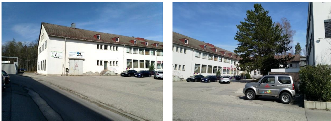
Abb. 3 und 4 Bestandsgebäude und Hofsituation mit Baumbestand, Ortseinsicht vom 02.04.2019

Die verkehrliche Erschließung des Grundstücks erfolgt von Osten über den südlichen Teil des Grundstücks Fl.Nr. 376. Zusätzlich ist im Norden ein Geh- und Fahrrecht für Anlieferverkehr vorhanden. Zur Bundesstraße ist ein Streifen mit Gehölzen vorhanden, eine direkte Zufahrt ist hier nicht vorhanden. Weitere Gehölze befinden sich entlang der nördlichen Grundstücksgrenze. Einzelbäume sind im hofartigen Bereich des Bestandsgebäudes vorhanden. Die technische Erschließung (Wasserversorgung, Abwasser- und Abfallentsorgung sowie leitungsgebundene Energie und Telekommunikationslinien) sind bereits vorhanden.