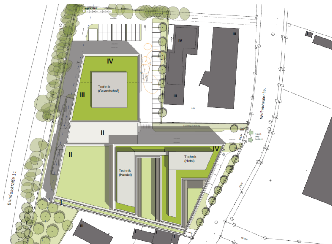
Abb. 6 Vorhaben gemäß Vorhaben- und Erschließungsplan mit Stand vom 04.06.2019